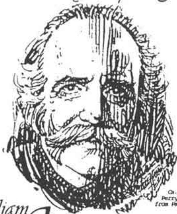
© 1976 Perry Helfman drawing from Paul Kalinian photo

William Saroyan 1908-1987 The Man The Writer